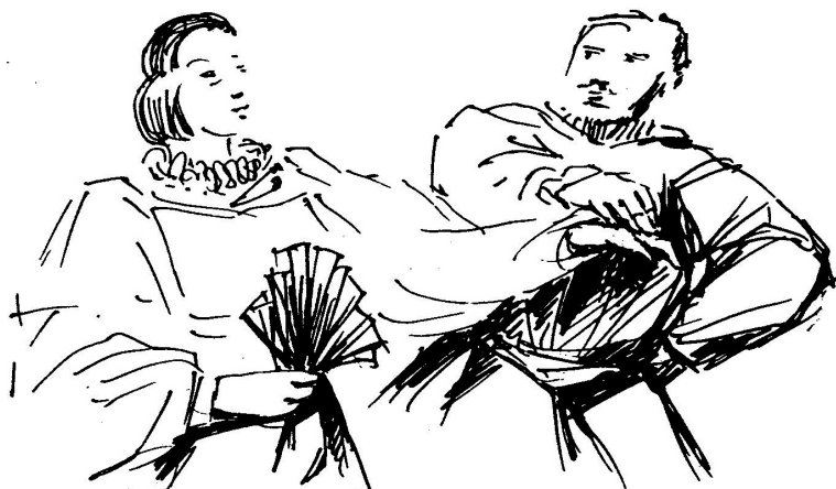
Slika 1: Drža rok v paru 1

Spodaj dodane fotografije služijo kot pomoč učitelju pri izvedbi ure, kajti v pripravi je podana razlaga plesa in učitelj si ob slikovnem gradivu lažje predstavlja, kako kakšen gib izvesti; npr. drža rok v paru, poklon dame in kavalirja. Po zmožnosti skupine oz. razreda lahko določene stvari prilagodite oz. izpustite (pokloni, figure ...).