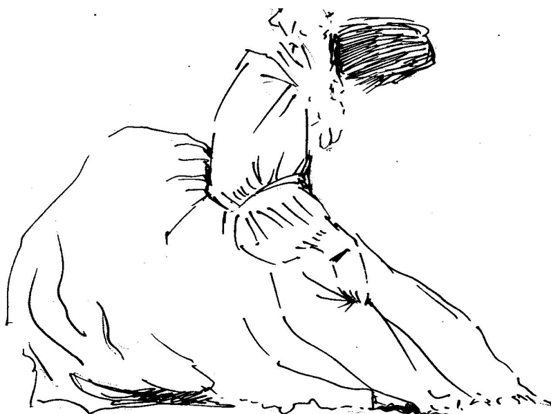
Slika 2: Poklon dame 2