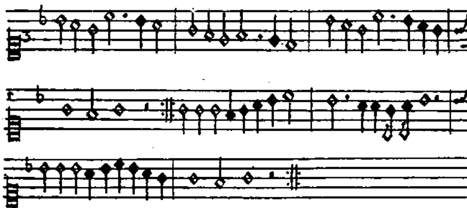
Slika 4: Melodija turdiona 4

Po metodi odmeva nauči melodijo turdiona: