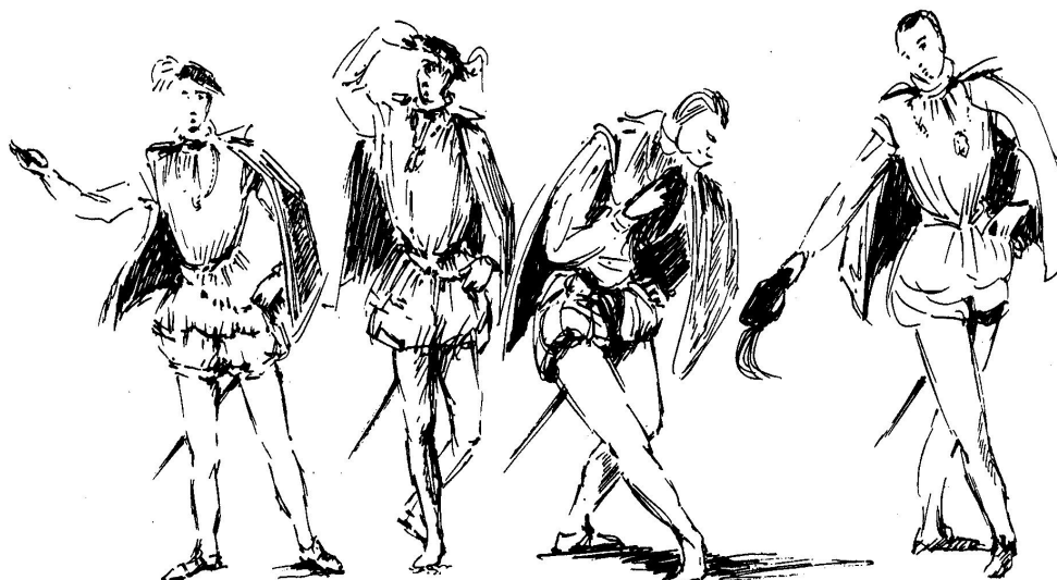
Slika 3: Poklon kavalirja 3

Po metodi odmeva nauči melodijo turdiona: